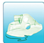
Респираторная маска для взрослых – 1 шт.