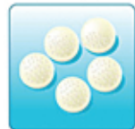
Воздушный фильтр – 5 шт.