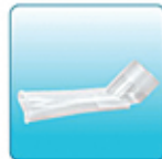
Насадка для рта – 1 шт.