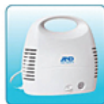
Основной блок в корпусе – 1 шт.